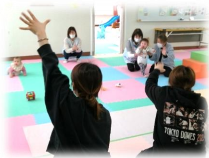
2月のハイハイレース こっちだよ～！