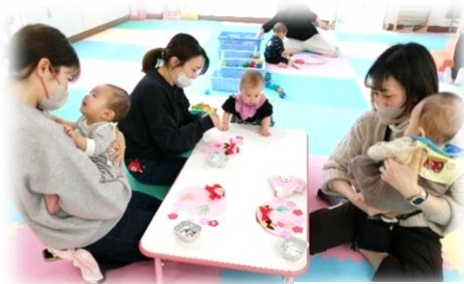
3月の手形アート かわいい手形でひな人形ができました。