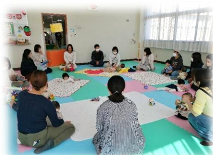
3月の赤ちゃんあつまれ！