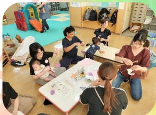
ハロウィンの飾り