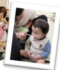
中学生の職場体験