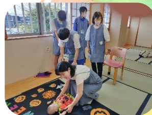
ハロウィン フォトスタジオ