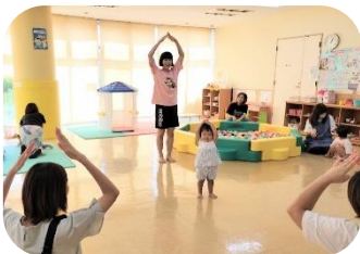
親子でリズム遊び